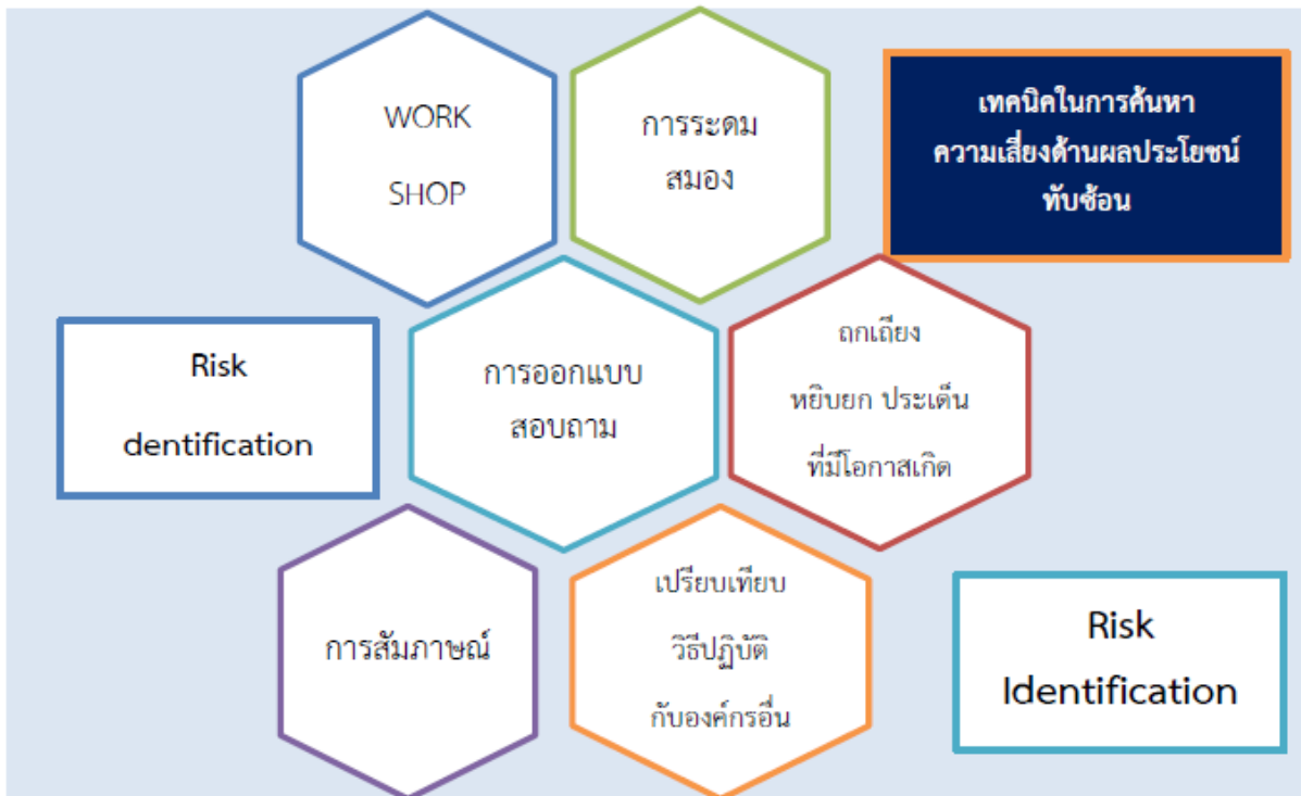
ตารางที่ ๑ ตารางระบุความเสี่ยง (Know Factor และ Unknown Factor)

เทคนิคในการระบุความเสี่ยงหรือค้นหาความเสี่ยงเกี่ยวกับผลประโยชน์ทับซ้อนด้วยวิธีการต่าง ๆ ดังนี้